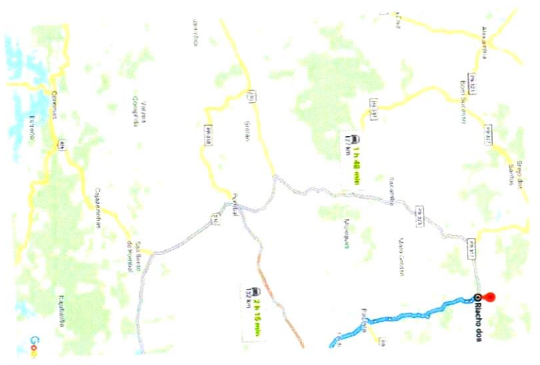
DMT – Usina para Obra escola →