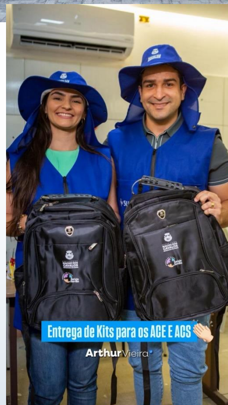
Entrega de Kits para os ACE E ACS