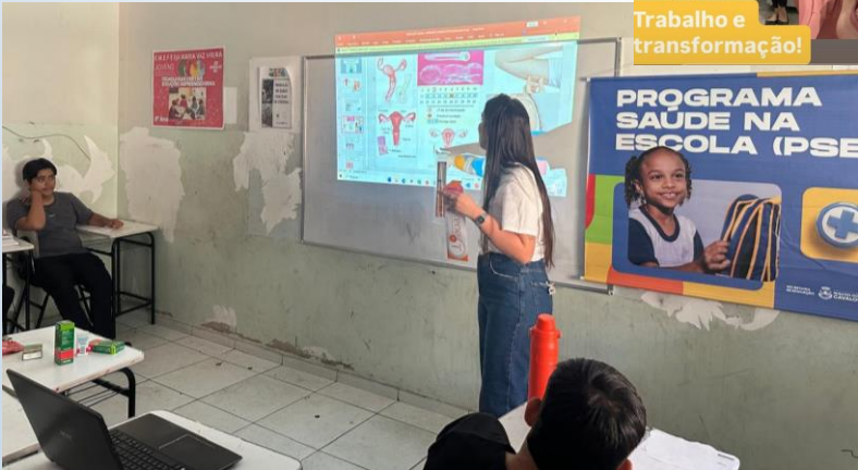
PROGRAMA SAÚDE NA ESCOLA (PSE)

A partir de hj, contamos com atendimento nutricional