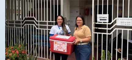
Atenção GESTANTES Recebemos hoje a vacina contra o vírus sincicial respiratório (bronquiolite que acomete crianças menores de 1 ano de idade)