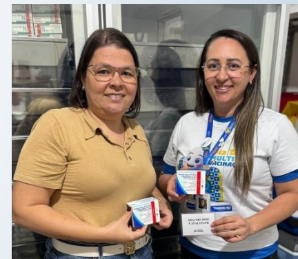
SECRETARIA DE ESTADO DA SAÚDE CATOLÉ DO ROCHA - PB