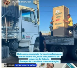
Hoje nosso município foi contemplado com uma câmara fria, mais uma parceria do governo do Estado. É tempo de trabalho e transformação, SECRETARIA DE SAÚDE