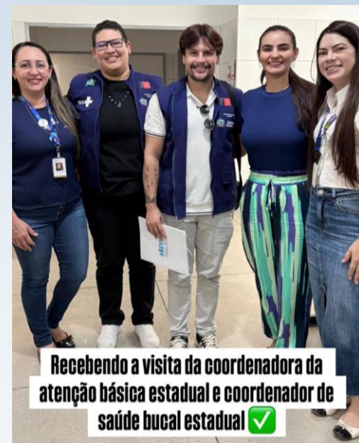
Recebendo a visita da coordenadora da atenção básica estadual e coordenador de saúde bucal estadual