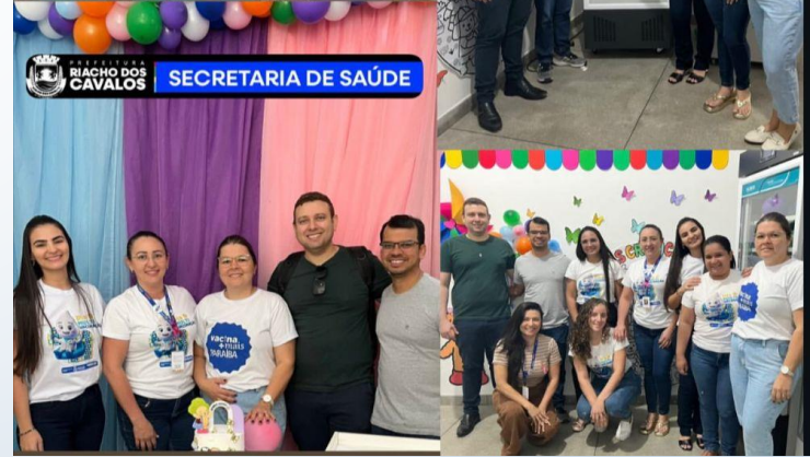
SECRETARIA DE SAÚDE