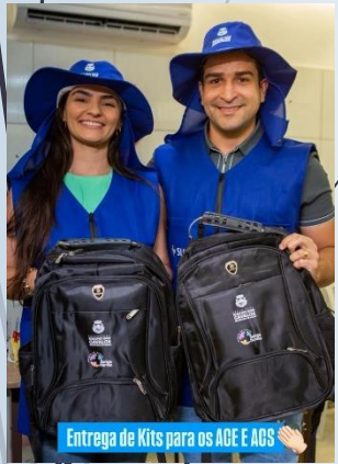
Entrega de Kits para os AGE E AGS