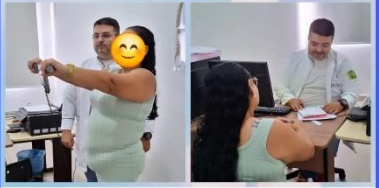
heliovieira.nutri Hoje dou mais um passo em minha vida profissional. Atender na Unidade de Saude da minha cid...