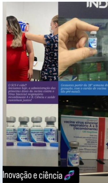
Inovação e ciência