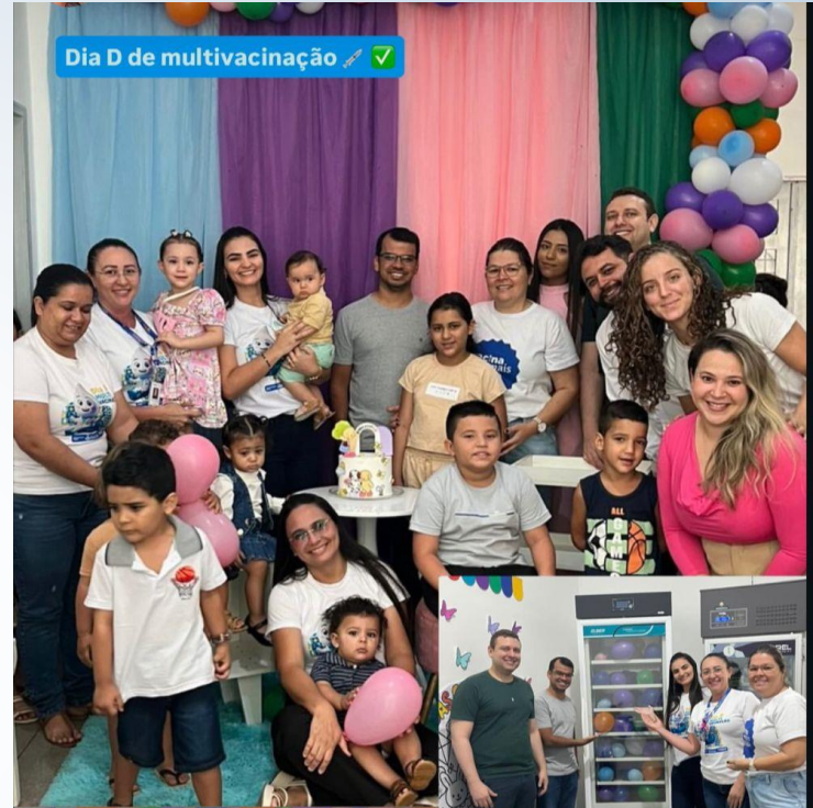
Dia D de multivacinação