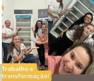
Trabalho e transformação!

A partir de hj, contamos com atendimento nutricional